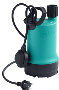
Semblable à la photo ci-dessus